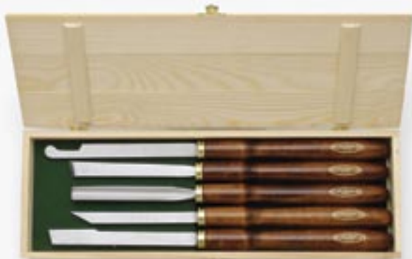
[ 600.04 ]