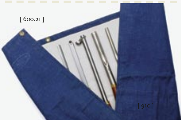
[ 600.21 ]