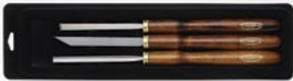
[ 600.01 ]