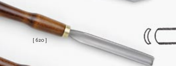
[ 620 ]