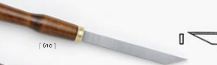
[ 610 ]