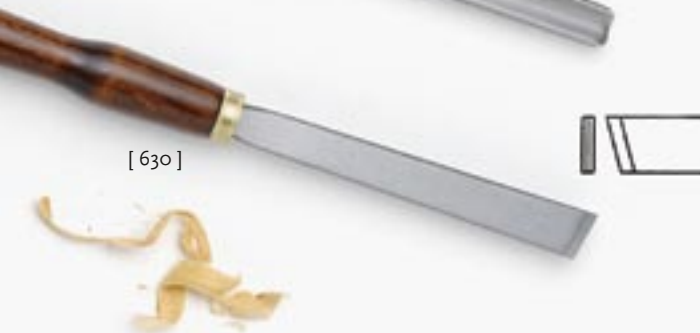
[ 630 ]